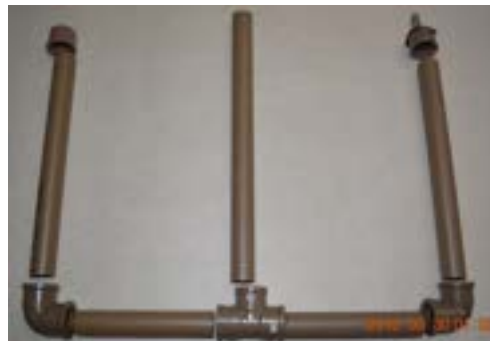
Fig. 8. Disposição em que serão montados os canos nas conexões.