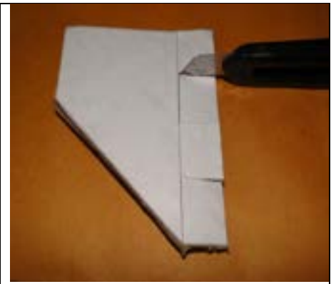
Fig. 3. Detalhe do corte da aleta