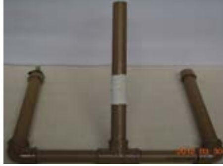
Fig. 14. Base com o esparadrapo sobre o bico do balão de aniversário.