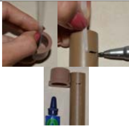
Fig. 11. Determinando a profundidade da conexão e marcando-a sobre a ponta do cano.