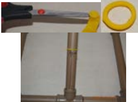
Fig. 13. Colocação do anel do balão a 8 cm acima do "tê".