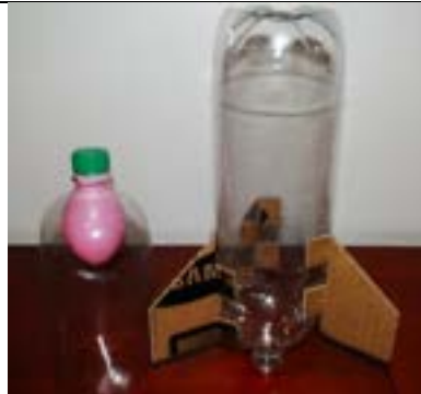
Fig. 5. Bico e foguete com aletas presas.