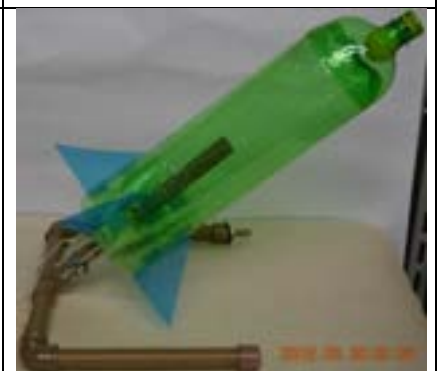
Fig. 21. Foguete pronto sobre a base.