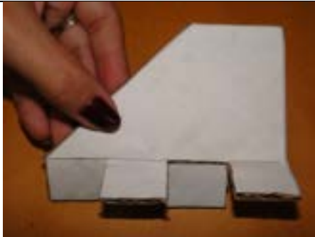
Fig. 4. Aleta pronta para ser fixada