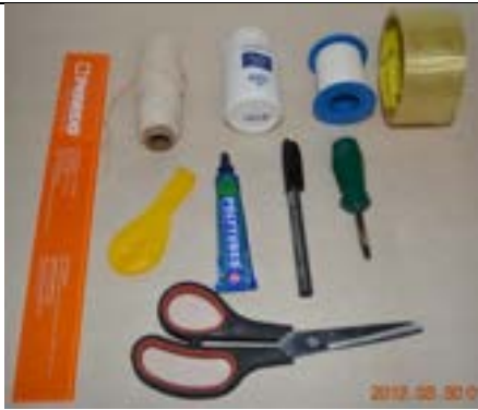
Fig. 10. Alguns dos acessórios usados na construção da base.