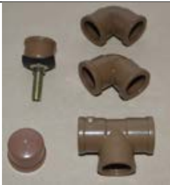
Fig. 7. As conexões que serão usadas na base de lançamento do foguete.