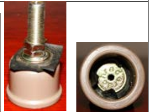
Fig. 9. Detalhes da válvula de pneu de bicicleta preso no "cap".