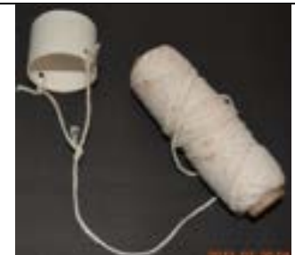
Fig. 18. Gatilho de liberação do foguete.