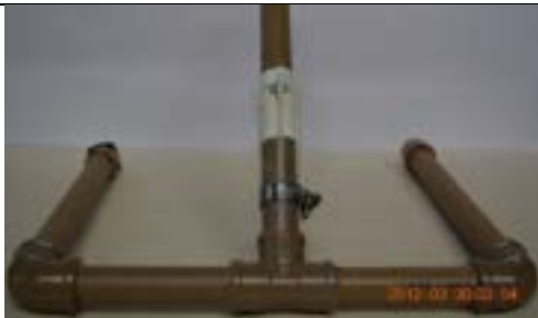
Fig. 16. Base com as 4 abraçadeiras de nylon presas com a abraçadeira de metal. Use 8 abraçadeiras!