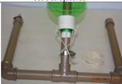
Fig. 19. Base com anel branco posicionado sobre as 4 "cabeças" de nylon.