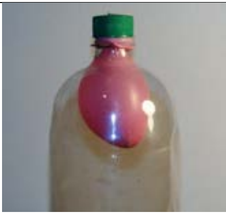
Fig. 1. Detalhe do "peso" preso dentro da ponta do foguete