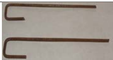
Fig. 20. Estacas que fixam a base de lançamento no solo.