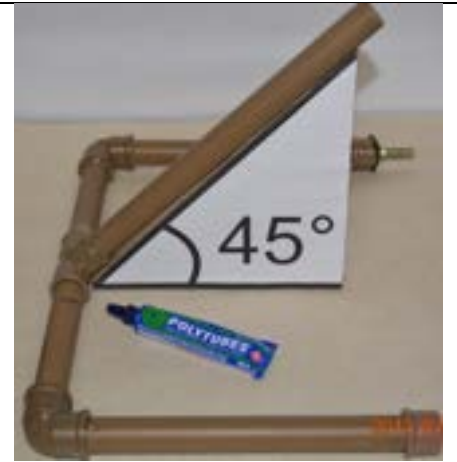
Fig. 12. Base montada.