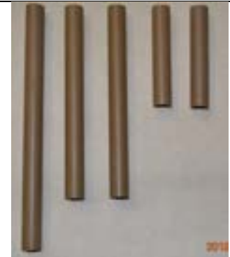
Fig. 6. Os canos da base.