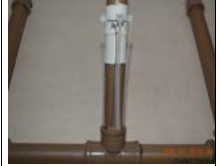
Fig. 15. Base com as 4 abraçadeiras de nylon.