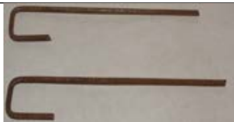
Fig. 20. Estacas que fixam a base de lançamento no solo.