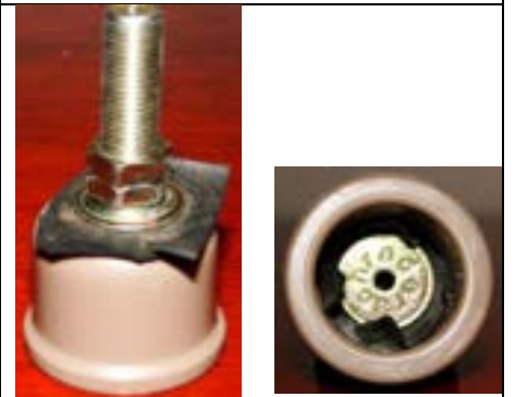
Fig. 9. Detalhes da válvula de pneu de bicicleta preso no "cap".