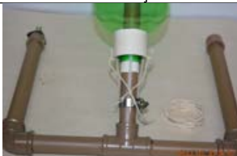
Fig. 19. Base com anel branco posicionado sobre as 4 "cabeças" de nylon.