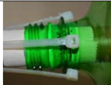
Fig. 17. Posição das cabeças das abraçadeiras sobre o anel sustentação.