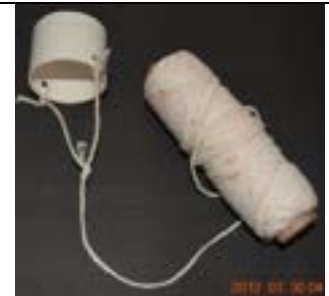
Fig. 18. Gatilho de liberação do foguete.