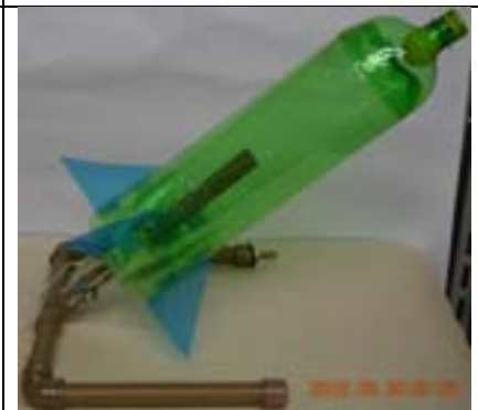
Fig. 21. Foguete pronto sobre a base.